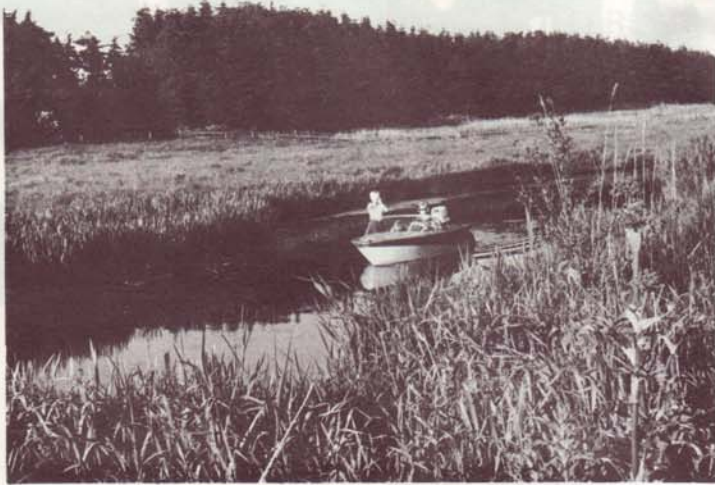
Motiv fra Værebros Å.